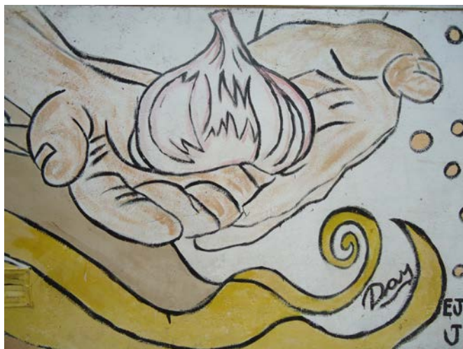
Figura 4. Barrio 25 de Mayo