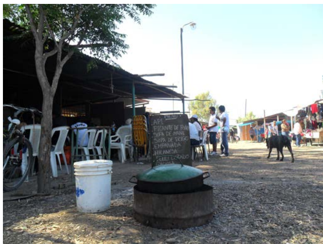
Figura 5. Productos ofrecidos en las ferias de Ugarteche, Cordón del Plata y 25 de Mayo