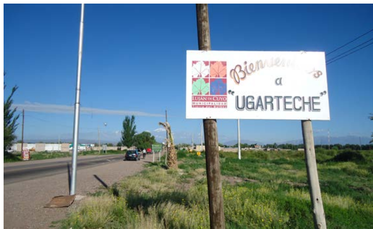
Figura 3. Localidad de Ugarteche y su carnaval

Durante la década de 1940 Ugarteche se convirtió en un polo de producción hortícola impulsado por algunas familias descendientes de europeos, que aprovecharon el tendido del ferrocarril y los