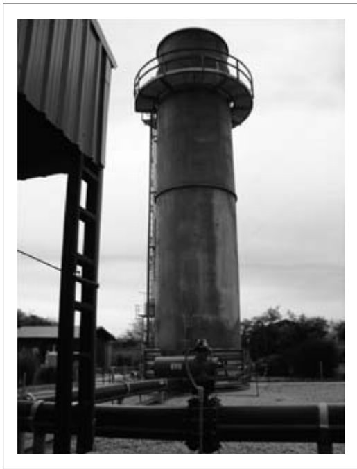
Foto 1. Planta de extracción y combustión de metano del relleno sanitario de Norte III

alto que el dióxido de carbono (Blanco, 2004). Varias empresas extranjeras, entre ellas las holandesas (Villa Domínico-Vander Wildt) e italianas (Norte III) desarrollaron redes de extracción, monitoreadas por una comisión de Naciones Unidas. La captación del gas metano en los rellenos sanitarios de Villa Domínico y Norte III marca una inflexión en las modalidades de revalorización de los residuos que se venía promocionando (fotos 1 y 2). Sin embargo, estas innovaciones tuvieron un impacto limitado. En Villa Domínico, la implementación tardía de estos dispositivos hace que las cantidades de metano captadas sean muy