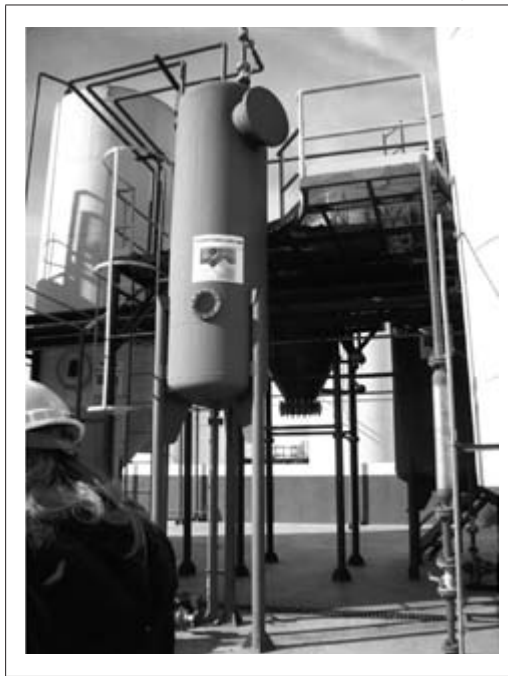
Foto 2. Procesamiento de aceite vegetal usado en la planta de RBA Ambiental en San Miguel

En 2006, en la Ciudad Autónoma de Buenos Aires, fue promulgada la Ley 1854 de Gestión Integral de Residuos Sólidos Urbanos, llamada ‘Basura Cero’ y ese mis-