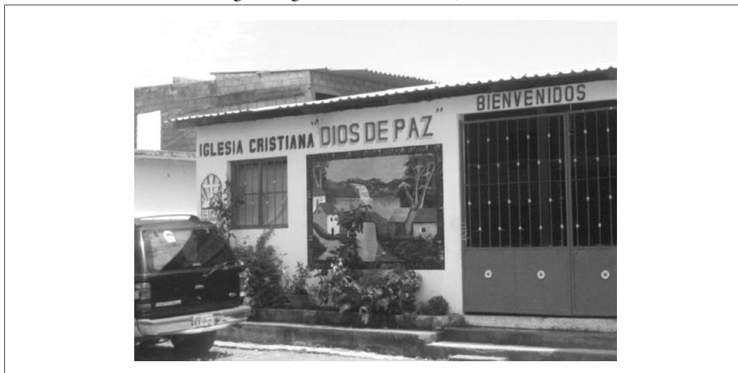
Imagen 3. Iglesia cristiana en Las Jarretaderas