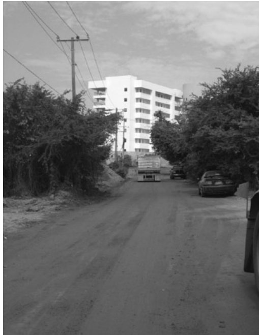
Imagen 6. Los límites de Las Jarretaderas