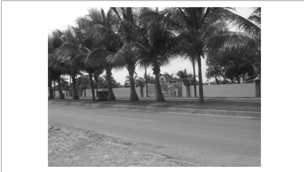
Imagen 8. Los límites de Las Jarretaderas