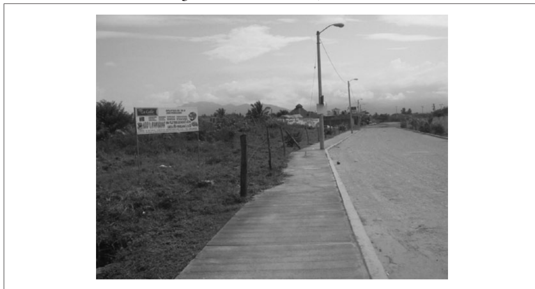
Imagen 7. Los límites de Las Jarretaderas