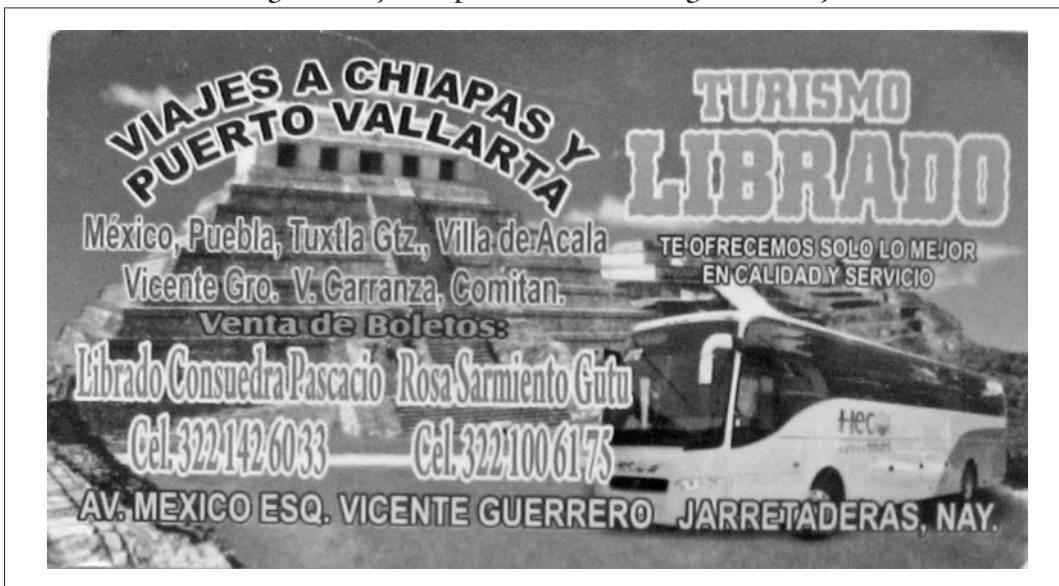
Imagen 2. Tarjeta de presentación de una agencia de viajes