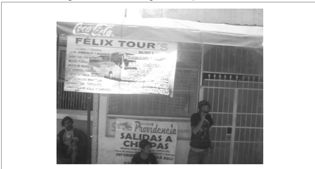
Imagen 1. Publicidad de las agencias de viajes en Las Jarretaderas

Fuente: archivo de la autora (2010, julio)