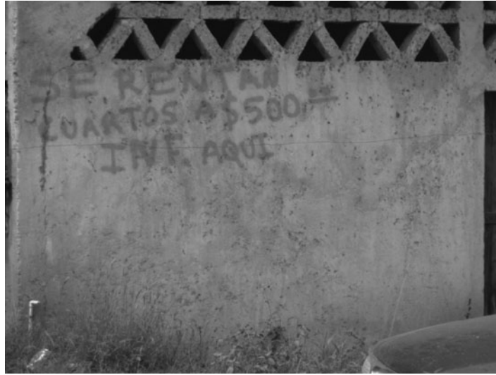
Imagen 5. La promoción de renta de cuartos