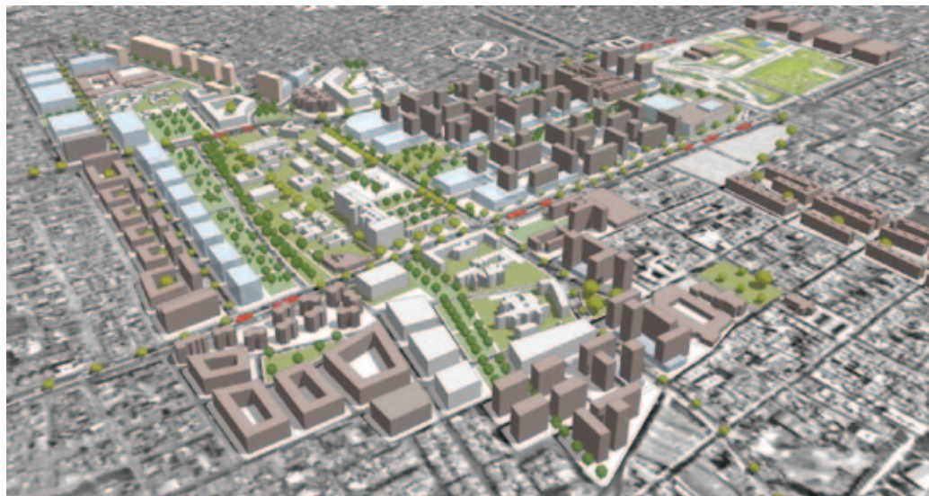
Figura 1. Proyecto Ciudad Salud

Nota: al fondo se puede apreciar el Parque Tercer Milenio (antigua Calle del Cartucho) y el proyecto de reconstrucción total del barrio San Bernardo y parte del barrio Las Cruces.