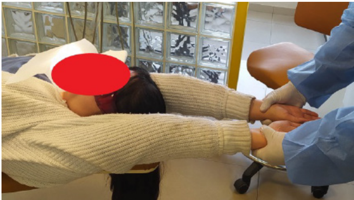
Figura 1. Evaluación de la cintura escapular

La cintura escapular se evaluó por el largo de los brazos. Para ello el investigador se ubicó por detrás del sillón dental; tomó las muñecas del paciente entre el dedo pulgar, el índice y el medio, y tiró ligeramente los brazos de manera simétrica en el plano sagital. A fin de asegurarse de que la posición del paciente sobre el sillón no provocara algún error del test, se le pidió relajar los brazos. La maniobra debe ser lo suficientemente firme y rápida, y si la cintura escapular está horizontal, los maléolos radiales estarán paralelos (figura 1).