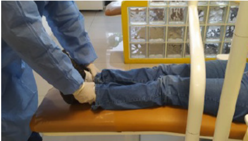
Figura 2. Evaluación de la cintura pelviana

Para la evaluación de la cintura pelviana en la misma posición de inclinación de 180° del espaldar del sillón dental se verificó que el paciente estuviera cómodo, derecho, con las piernas paralelas y relajadas sin hacer tensión. El investigador se ubicó por delante de los pies y con los dedos de las manos rodeó los tobillos, ubicó los maléolos tibiales (parte más prominente) y verificó su posición para determinar si estaban paralelos o en el mismo nivel. Así se consideró alineada la cintura pelviana o, por el contrario, se consideró no alineada (figura 2). Ambas evaluaciones se realizaron con la boca entreabierta y sin contactos oclusales.