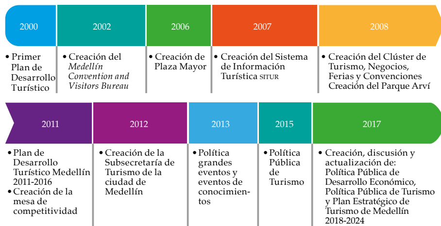
Figura 1. Aspectos institucionales del turismo en Medellín

negocios. En ese mismo año, se creó el Parque Arví, como una apuesta de la ciudad en la línea de turismo de naturaleza (Alcaldía de Medellín & Centro de Ciencia y Tecnología de Antioquia –CTA–, 2015).