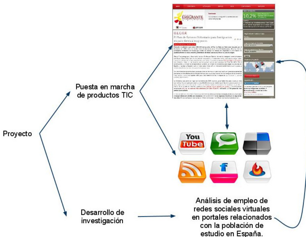
Figura 1: Actividades desarrolladas desde el proyecto Formación de redes de apoyo para el retorno voluntario de extranjeros colombianos residentes en la Comunidad Autónoma de Andalucía, alrededor de las TIC.

Versión PDF para imprimir desde http://erevistas.saber.ula.ve/index.php/Disertaciones