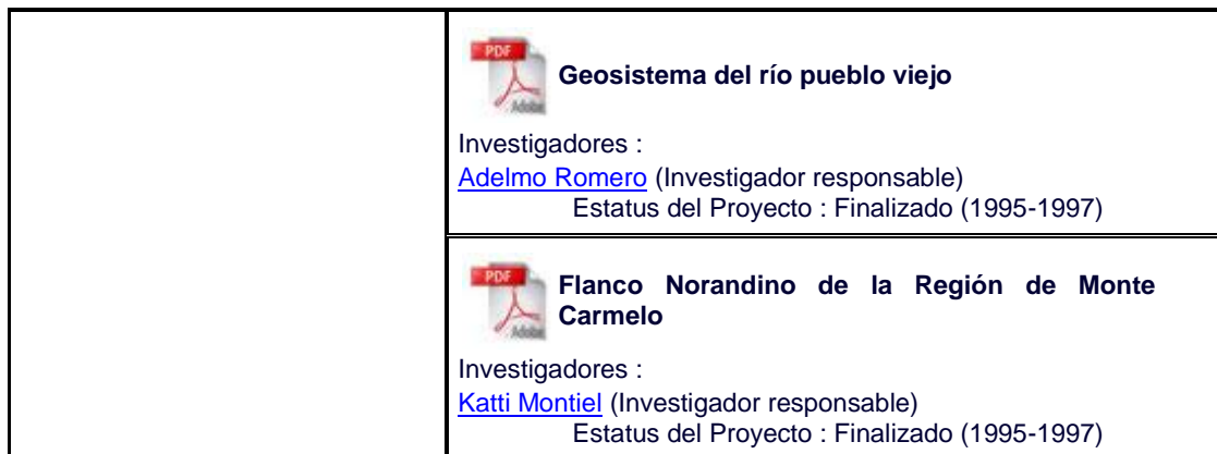
Cuadro 3. Proyectos de Investigación de la Línea de Investigación Geodinámica Ambiental y Riesgos Naturales Fuente: www.sigec.luz.edu.ve/linea_investigacion_geodinamica

http://erevistas.saber.ula.ve/index.php/Disertaciones