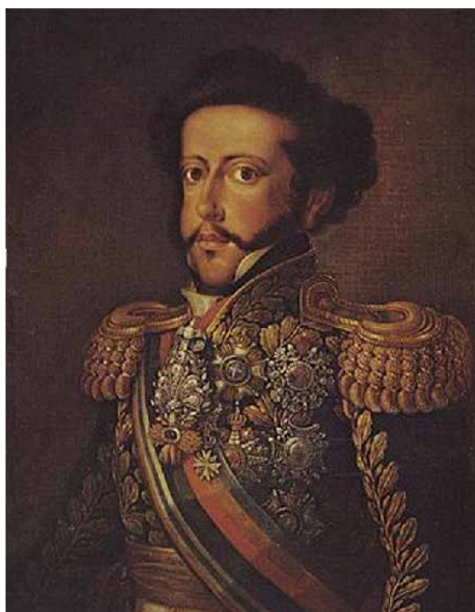
Figura 2. Retrato de D. Pedro I, 1826 Simplicio de Sá