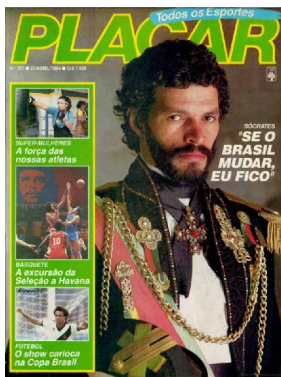
Figura 1. Capa da revista Placar , edição 727, de 27 de abril de 1984

Na edição 727, de 27 de abril de 1984, a revista Placar , um dos principais veículos de mídia esportiva brasileira, trouxe em sua capa uma imagem do jogador Sócrates vestido com trajes monárquicos, evocando de forma explícita o imperador dom Pedro I. A referência visual, associada à manchete “Se o Brasil mudar, eu fico”, rompeu com a estética habitual do jornalismo esportivo 1 e construiu um gesto editorial que ativou memórias históricas, particularmente o episódio do “Dia do Fico”, de 1822. Essa composição inusitada chamou atenção não apenas por seu impacto gráfico, mas também pelo modo como articulou universos aparentemente distintos: o futebol, a história política e o debate democrático em curso.