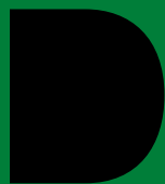
Tabela 1. Classificação dos enunciados analisados