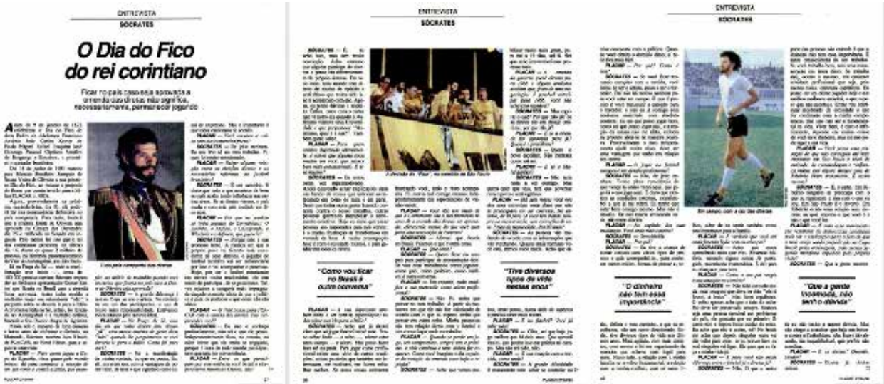
Figura 4. Entrevista com Sócrates publicada na edição 727 da revista Placar, pp. 37-40

No tópico a seguir, analisamos os textos à luz da teoria de Ducrot, buscando evidenciar os ditos e os implícitos no discurso da Placar.